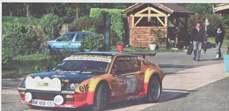
Une quinzaine de pilotes ont participé à cette 22 e édition au départ du Rouret.

Les concurrents enchaînaient ensuite sur la traversée de la Durance et la découverte lors du contrôle horaire du village de Lurs. Après une pause bien méritée au bistrot de pays, la journée se terminait sur un morceau de bravoure, la bien nommée Montagne de