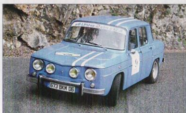
▲ Parmi les plus anciennes du plateau, la Renault 8 Gordini 1969 de Louis Spaccapelo et Raoul Cresp.