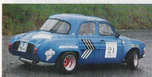
▲ Didier Billaud s'est laissé aller à quelques figures maîtrisées sur les notes humides de la montée de Tanneron avec son proto Dauphine de 1965.