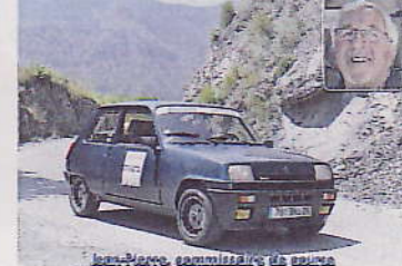
Jean-Marie, commissaire des courses