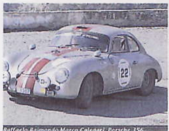
Raffaello Raimondo/Marco Calegari, Porsche 356

Pour les nouveaux concurrents, l'engagement est de 100 euros.